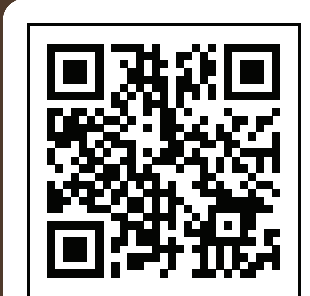
ชมคลิป "คลื่นยักษ์" เกิดขึ้นได้อย่างไร