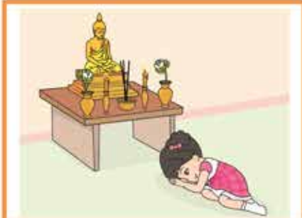
การกราบพระ

★ สันทนาจากภาพพร้อมฝึกปฏิบัติ และวาดภาพหรือคิดรูปภาพการกราบ หรือการไหว้ของตนเอง