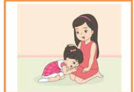
การกราบผู้ใหญ่