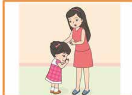
การไหว้ผู้ใหญ่